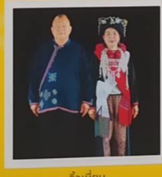
จิ้งเยียน