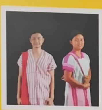
กะเหรี่ยง (โพล่ง)