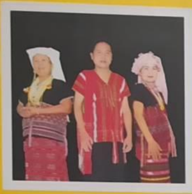
กะเหรี่ยง (ปากกะญอ)