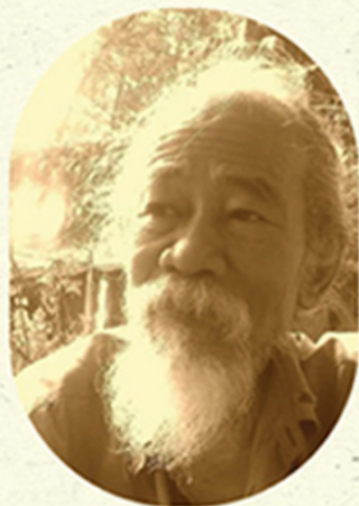
“บำรุง บุญปัญญา” ราชสีห์อีสาน นักคิด นักปฏิบัติระดับแนวหน้าของประเทศไทย เป็นผู้เสนอแนวคิดวัฒนธรรมชุมชน อันเป็นแนวคิดที่ทรงพลังในการพัฒนาท้องถิ่น สร้างเสริมศักยภาพของชุมชนคนอีสาน